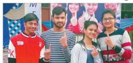
ਆਧਾਰਨ, ਸ਼੍ਰੋਮਣੀ, ਗੁਜਰ, ਤਾਨਿਆ ਵ ਸੁਨਿਧਿ ਪ੍ਰਥਮ ਵਾਰ ਮਤਦਾਨ ਕਰਕੇ ਪਸ਼ਾਤ ਸੈਲਫੀ ਪ੍ਰਾਫ਼ਟ ਪਰ। (ਸੰਗਲਾ)

ਸੰਗਰੂਰ, 4 ਫਰਵਰੀ (ਬੋਦੀ, ਮੈਂ 84 ਪ੍ਰਤੀਸ਼ਤ, ਸੁਨਾਮ ਮੈਂ 84 ਪ੍ਰਤੀਸ਼ਤ, ਹਰਜਿੰਦਰ): ਜ਼ਿਲ੍ਹਾ ਸੰਗਰੂਰ ਮੈਂ 85 ਪ੍ਰਤੀਸ਼ਤ, ਪੰਜਾਬ ਵਿਧਾਨਸਭਾ ਚੁਨਾਵ-2017 ਵੀਰਨ ਅਤੇ ਮਤਦਾਨ ਕਲੇਕਾ ਕਾਰਜ ਅਸਨ-ਸ਼ਾਂਤਿ ਸੇ ਸੰਪਤ ਹੁਆ। ਜਿਲੇ ਮੈਂ 7 ਵਿਧਾਨਸਭਾ ਹਲਕਿਆਂ ਮੈਂ ਲਗਭਗ 83 ਪ੍ਰਤੀਸ਼ਤ ਵੋਟਾਂ ਕਾ ਪ੍ਰਾਪਤ ਹੁਆ। ਜ਼ਿਲ੍ਹਾ ਚੁਨਾਵ ਅਧਿਕਾਰੀ-ਕਮ-ਡਿਊ ਕਮਿਸ਼ਨਰ ਡਾ. ਅਭਿਨਵ ਟੁਕਾ ਨੇ ਬਤਾਯਾ ਕਿ ਹਲਕਾ ਲਹੜਾ ਮੈਂ 83 ਪ੍ਰਤੀਸ਼ਤ, ਦਿੱਬਾ ਮਾਲੇਕੋਟਲਾ ਮੈਂ 85 ਪ੍ਰਤੀਸ਼ਤ, ਅਮਰਗੜ੍ਹ ਮੈਂ 83 ਪ੍ਰਤੀਸ਼ਤ, ਧੂਰੀ ਮੈਂ 82 ਪ੍ਰਤੀਸ਼ਤ ਅਤੇ ਸੰਗਰੂਰ ਮੈਂ 83 ਪ੍ਰਤੀਸ਼ਤ ਵੋਟਾਂ ਕਾ ਪ੍ਰਾਪਤ ਹੁਆ। ਤਲੇਖਨੀਯ ਹੈ ਕਿ ਜ਼ਿਲ੍ਹਾ ਸੰਗਰੂਰ ਮੈਂ 7 ਵਿਧਾਨਸਭਾ ਹਲਕਿਆਂ ਸੇ 66 ਉਮੀਦਵਾਰ ਚੁਨਾਵ ਮੈਦਾਨ ਮੈਂ ਹੈਂ ਅਤੇ ਜਿਲੇ ਮੈਂ 11,51,122 ਵੋਟਰ ਹੈਂ, ਜਿਨਮੇਂ ਸੇ 12652 ਪੁਰੁਖ ਵ 538457 ਮਹਿਲਾ