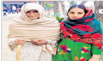
ਪਿੰਡ ਘਾਬੀਵਾਲਾ ਵਿਖੇ 95 ਸਾਲ ਦੀ ਮਾਤਾ ਆਪਣੀ ਵੋਟ ਪਾ ਕੇ ਆਉਂਦੀ ਹੋਈ।