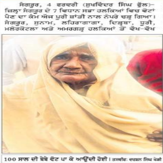
100 ਸਾਲ ਦੀ ਬੇਬੇ ਵੋਟ ਪਾ ਕੇ ਆਉਂਦੀ ਹੋਈ।

ਵੋਟਾਂ ਪੈਣ ਦਾ ਕੰਮ ਅਮਨ ਅਮਾਨ ਨਾਲ ਨੇਪਰੇ ਚੜ੍ਹਨ 'ਤੇ ਪ੍ਰਸ਼ਾਸਨ ਨੇ ਲਿਆ ਸੁੱਖ ਦਾ ਸਾਹ